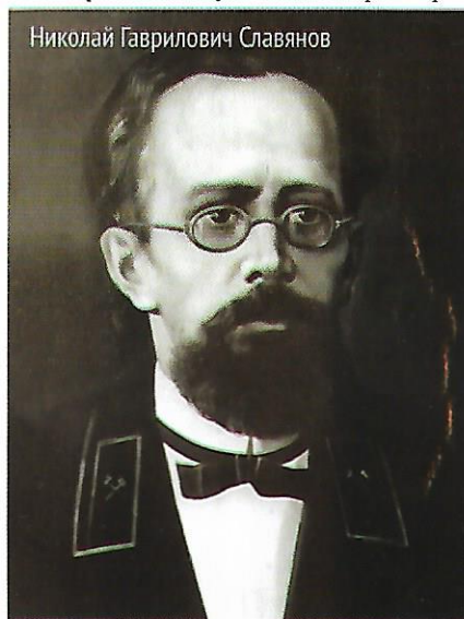
Николай Гаврилович Славянов